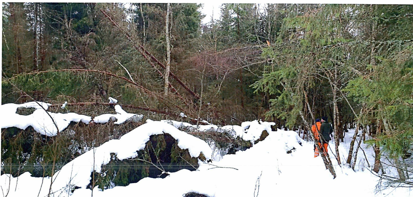
Vindfall etter stormene vinteren 2025 i Søndre Egge.

2025 ble et spesielt år for foretaket da vi ble rammet av 2 sterke stormer gjennom vinteren. Det resulterte i mye opprydding av vindfall i skogene som medførte store inntekter på hogst. Driftsutgiftene ble da også adskillig større enn budsjettert som følge av dette. Ellers ble budsjettutgiftene i driftsregnskapet stort sett gjennomført etter økonomiplanen for 2025.