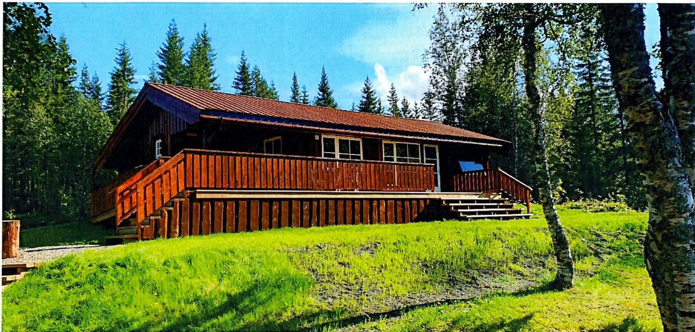
Lustadstu – ferdig totalrestaurert.

Det er brukt ca. kr 20 000 til friluftslivstiltak over driftsregnskapet. Herav er ca. kr 10 000 fordelt på lønn til egne ansatte. Denne type tiltak ble nedprioritert i 2025 da det meste av tiden gikk med til å restaurere Lustadstu som ligger under investeringsregnskapet, samt at vi måtte prioritere opprydding av vindfall på steder med mindre skadeomfang manuelt etter de omtalte stormene.