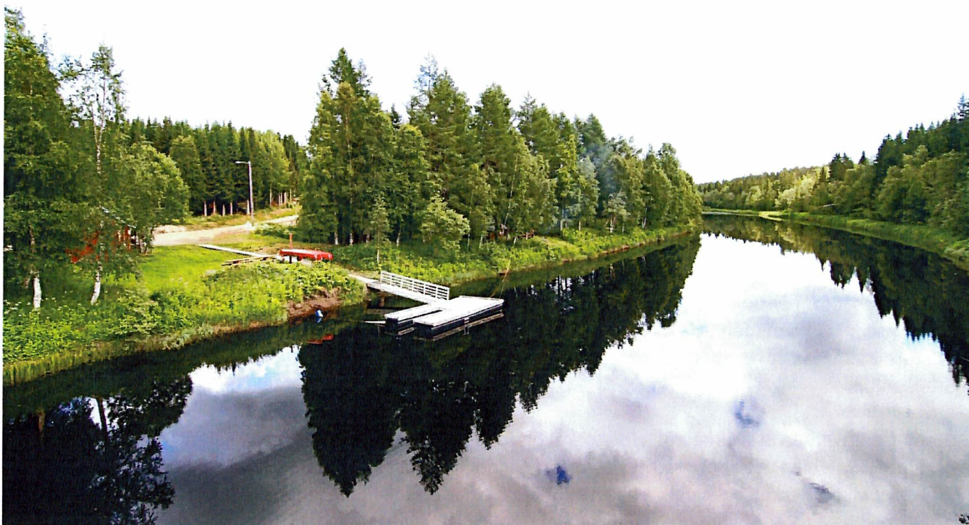
Anlegg for kanopadlinga i Støa

Det er utarbeidet avtale om en digital reklame ved JS Norge. Den digitale utgaven er ment å være et supplement til den brosjyren vi allerede har i dag, og er spesielt produsert for å reklamere for kanoutleien i Ognå.