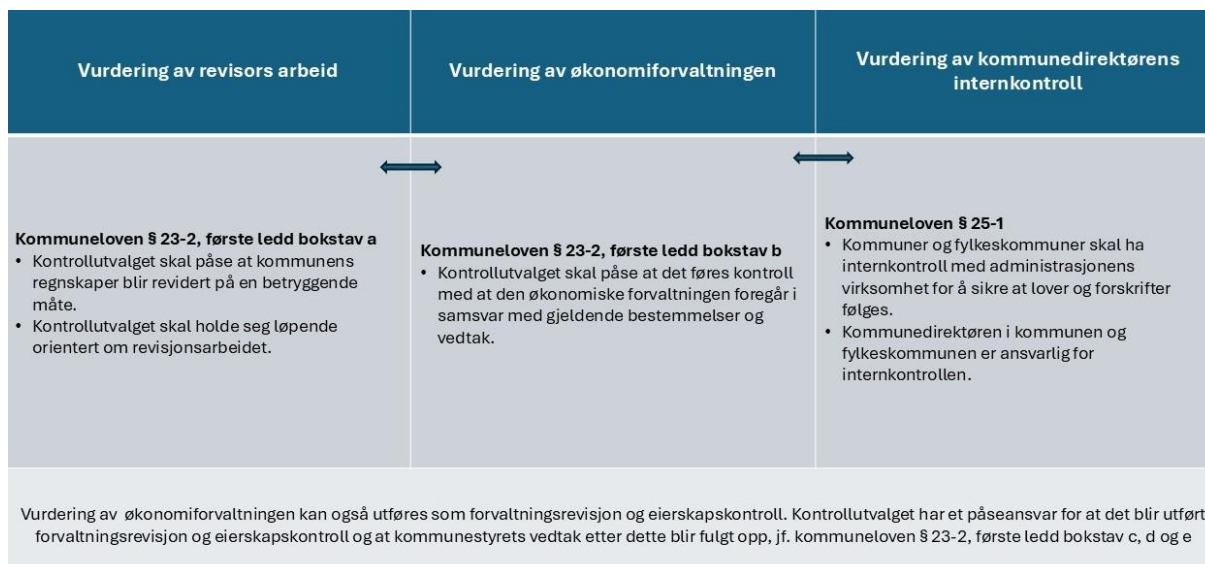
Figur 1 Sammenhengen mellom påseansvaret for de ulike lovpålagte oppgavene kontrollutvalget har etter kommuneloven § 23-2, og kommunedirektørens internkontroll etter kommuneloven § 25-1.