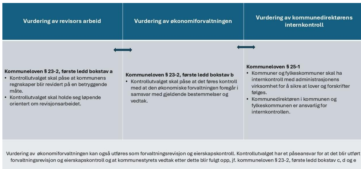
Figur 1 Sammenhengen mellom påseansvaret for de ulike lovpålagte oppgavene kontrollutvalget har etter kommuneloven § 23-2, og kommunedirektørens internkontroll etter kommuneloven § 25-1.