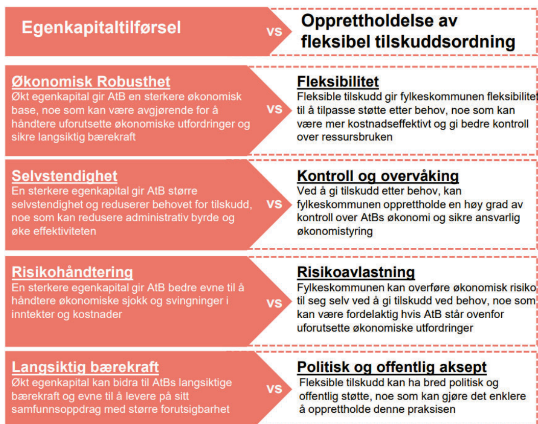
Figur 1 Egenkapitaltilførsel vs. opprettholdelse av fleksibel tilskuddsordning

Ifølge PwC er det mange hensyn som må balanseres i forholdet mellom AtB og Trfk. Figur 1 viser egenskaper ved egenkapitaltilførsel sammenlignet med å opprettholde dagens egenkapitalnivå og håndtere alle større økonomiske utfordringer politisk. Det vil i de fleste tilfeller dreie seg om ekstra tilskudd, garantier eller om det skal gjennomføres