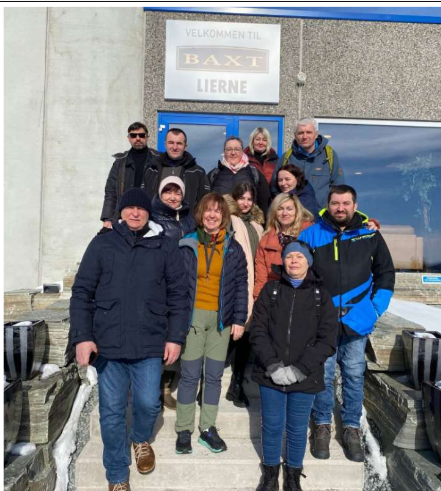
Lierne voksenopplæring på besøk til Baxt Lierne en vakker vårvinterdag i 2023.

Compilo benyttes som kommunens avvik- og internkontrollsystem. Det er fortsatt et mål å forbedre innhold og bruk av dette systemet, og få alle ansatte opp på samme kunnskapsnivå på dette systemet.