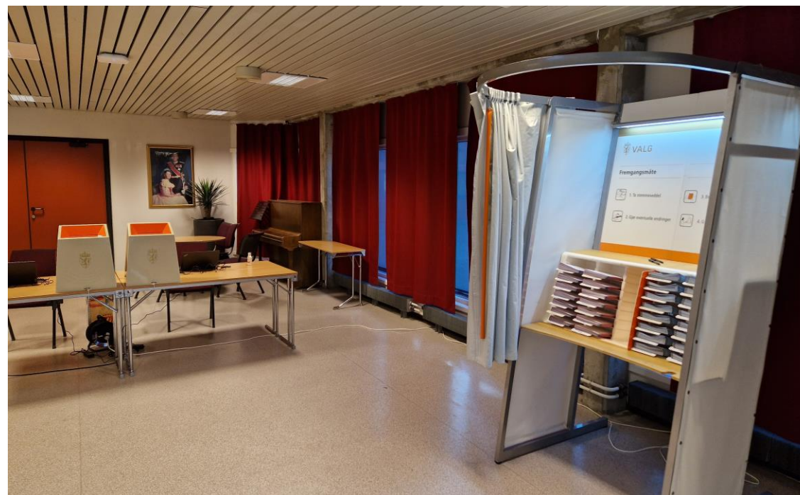
Bilde av kommunestyresalen rigget til forhåndsstemming ved kommunestyre- og fylkestingsvalget 2023.