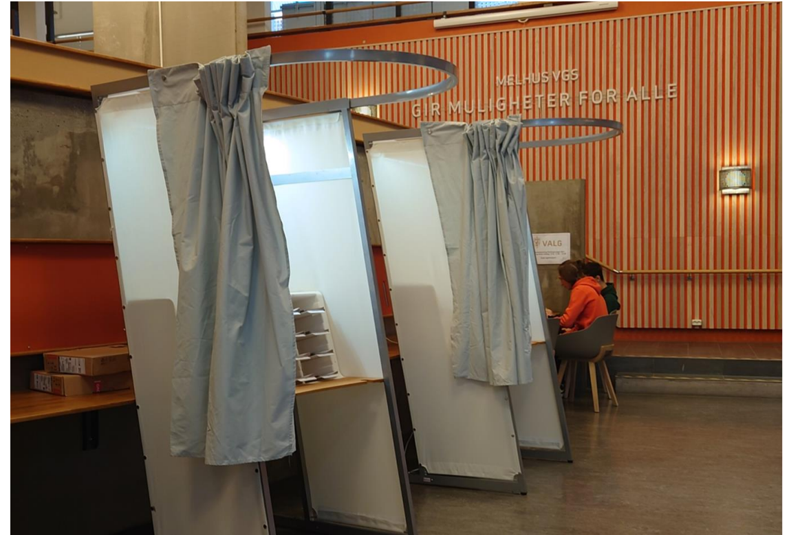
Bilde av forhåndsstemming på Melhus vgs i forbindelse med stortingsvalget 2021

Informasjon, oppdateringer og rutiner pr e-post