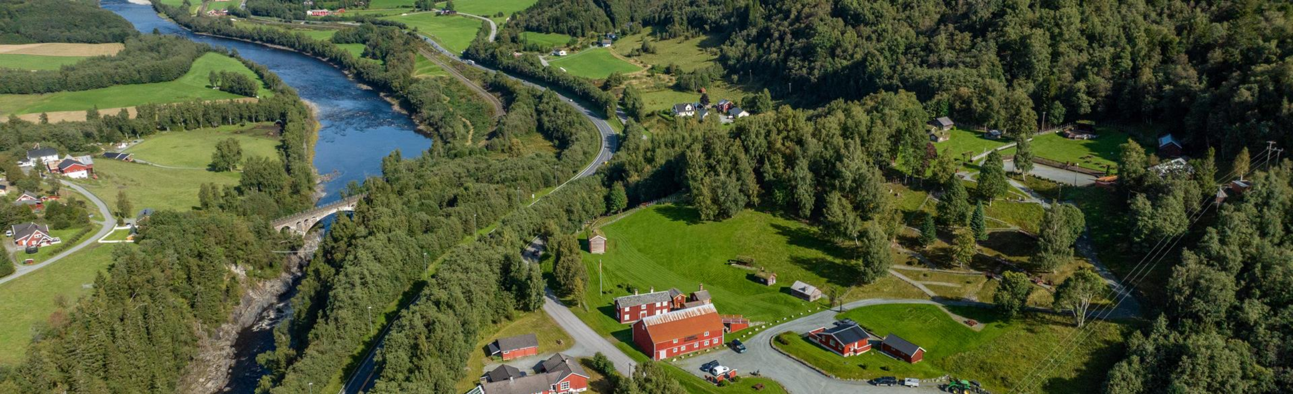
Bilde av Horg bygdatun, Hovin, Gaula og Gaulfoss jernbanebru