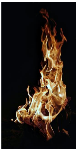
Brann- og redningsselskap