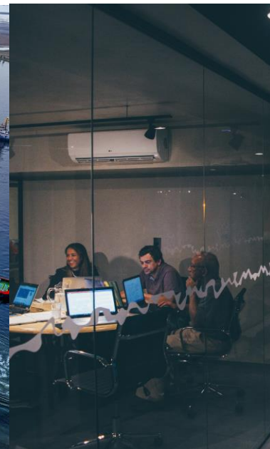
Revisjons- og sekretariatselskap