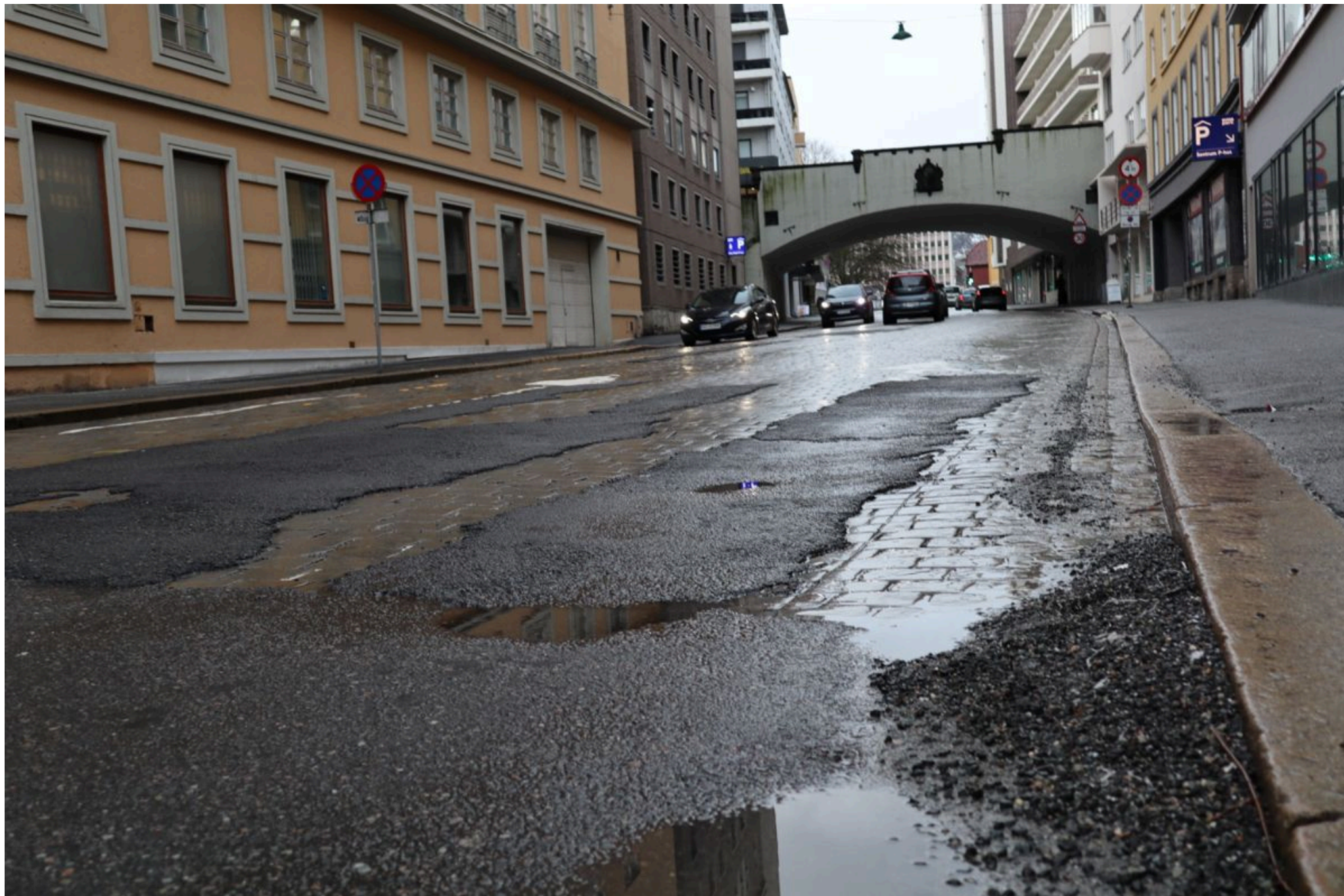
Et lappeteppe av asfalt og gatestein på fylkesvei gjennom Bergen sentrum.