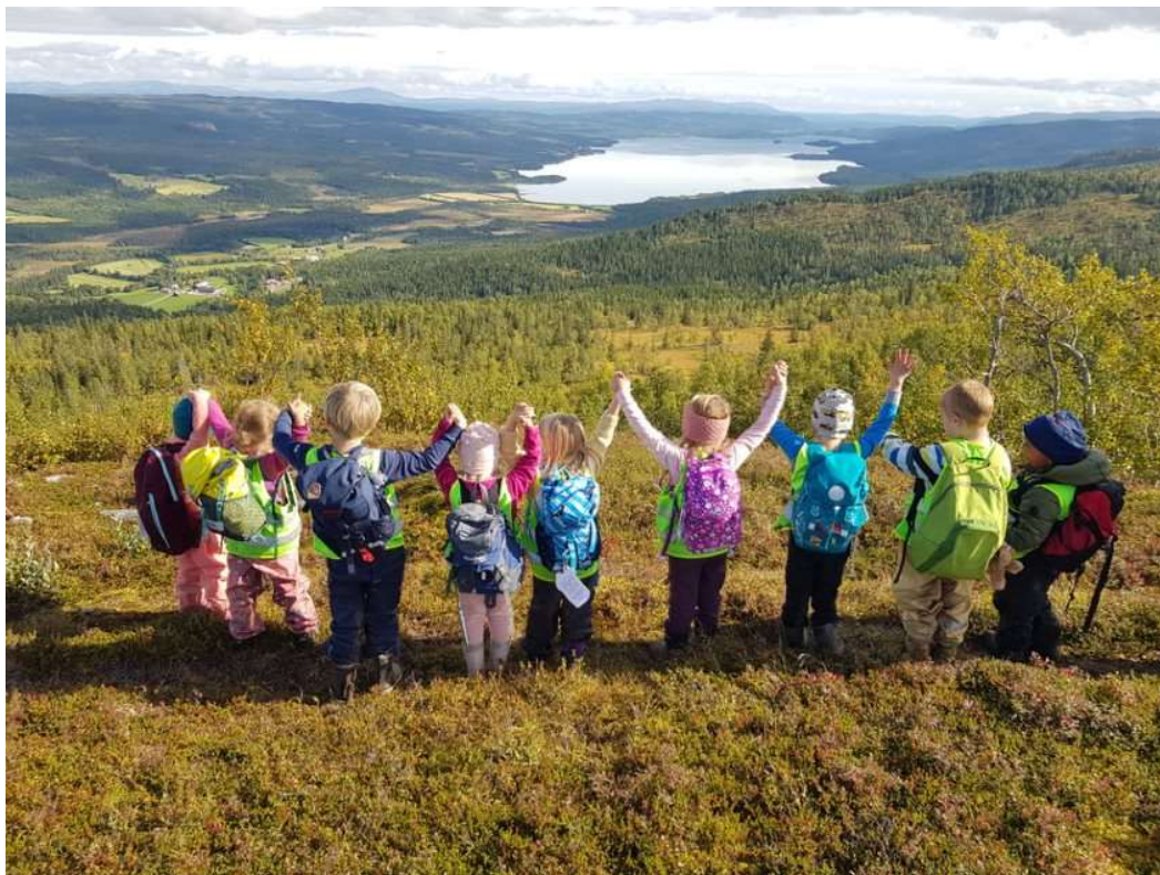
Sandvika barnehage på tur til Nonsfjellet.