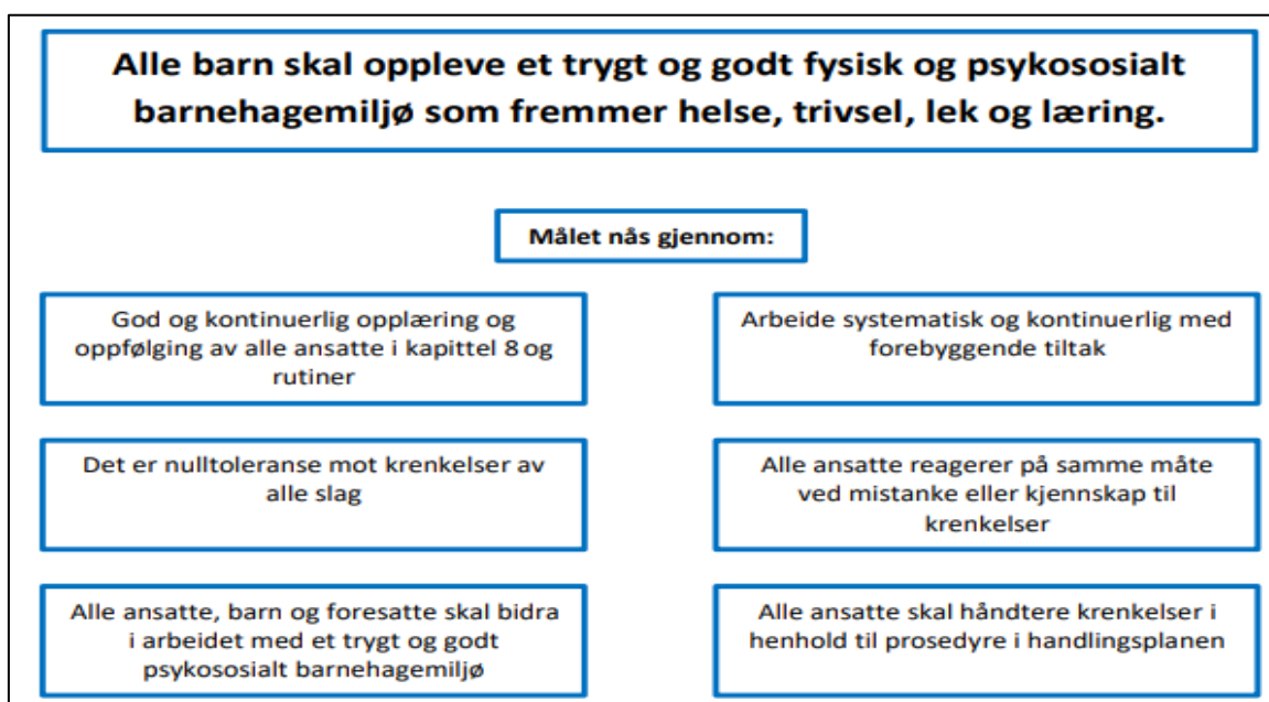
Figur 2. Mål og tiltak i handlingsplanen for psykososialt barnehagemiljø

Kilde: Kap. 2 i handlingsplan for psykososialt barnehagemiljø.