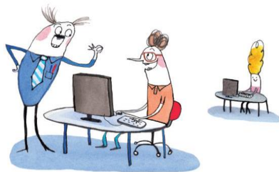
illustrasjon: Pia Olsen

10-FAKTOR måler medarbeiders oppfatning av viktige forhold på arbeidsplassen, og medarbeiders holdninger til egen jobb.