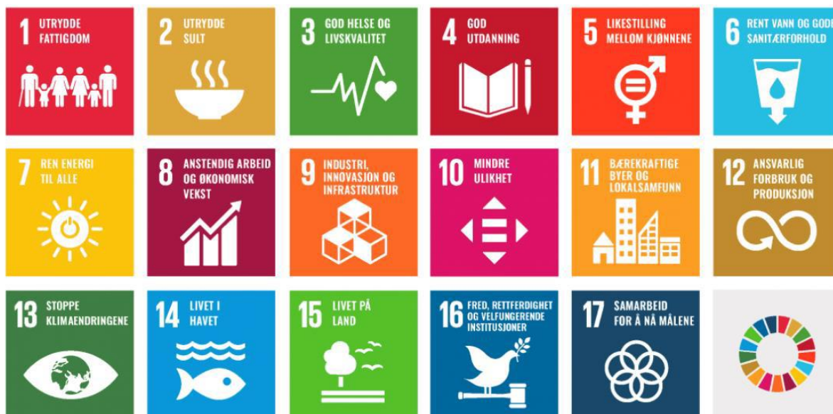
Oversikt over FNs 17 bærekraftsmål

Verdensmålene for bærekraftig utvikling ble vedtatt av FNs medlemsland i 2015. Målene gjelder for alle land, og alle land har ansvar for å bidra til å nå dem. Også fylkeskommuner og kommuner har en rolle i oppfølgingen av bærekraftsmålene. Ambisjonen er å oppnå velstand for alle på en måte som er forenlig med miljø- og klimahensyn. Bærekraftsmålene består av 17 hovedmål og 169 delmål. Koronapandemien gjør det enda mer utfordrende å nå disse målene. I Norge handler arbeidet med bærekraftsmålene om hvordan målene konkretiseres og følges opp i tråd med regjeringens politikk.