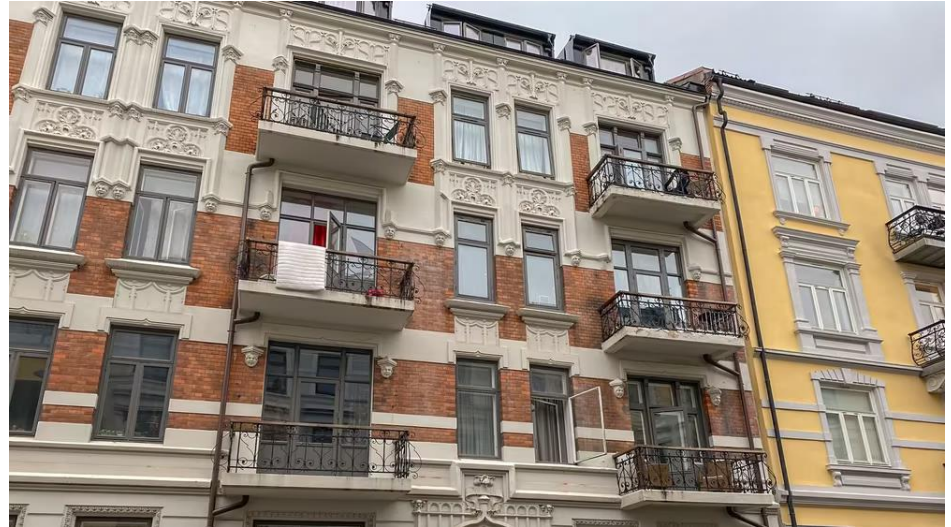
Boligbyggskandalen i Oslo