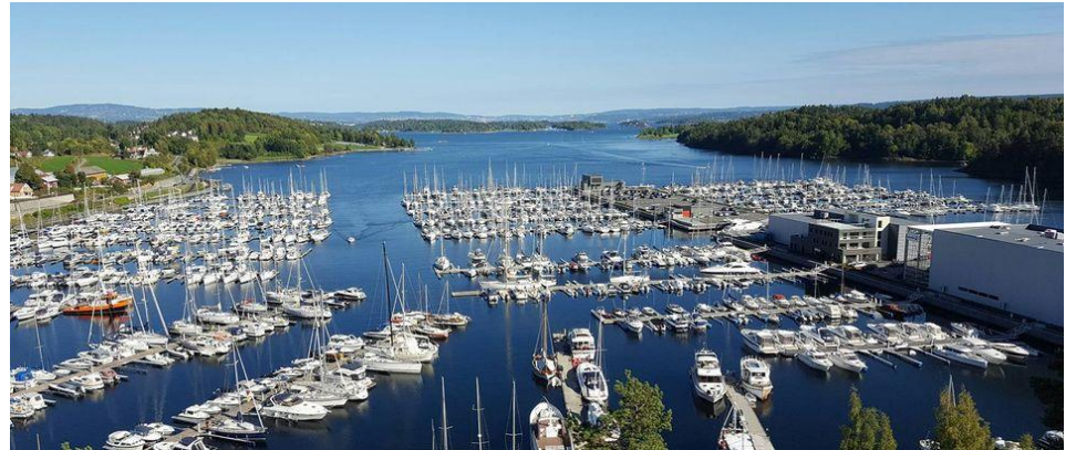
Leanbukten Båtforening Andelslag

Beyonce eller det lokale harmonikaorkesteret?