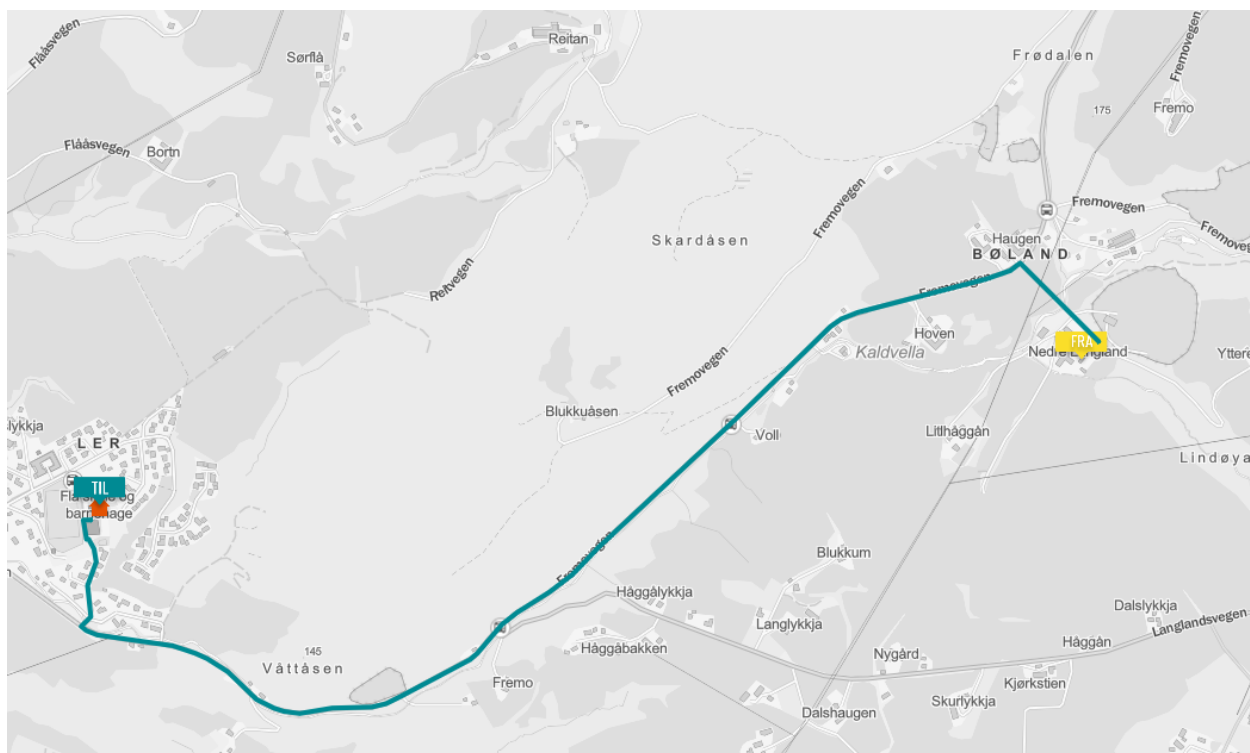
Figur 1: Elevens skoleveg, ca. 3 km øst for Flå skole

Eleven bor i xxxxxxxx xx, ca. 3 km øst for Flå skole, der hen begynner i 2.trinn høsten 202x. Fra hjemmet må eleven gå langs PV99594 ca. 140 meter før hen kommer til Fremovegen (FV6594). På denne vegen ligger en usikret bru. Det er kun lokal befolkning som kjører her, og det ble gjort en trafikkteiling i 2021. ÅDT* er 91, hvorav 15 % andel lange kjøretøy. Det er svært lave tall. Gjennomsnittlig fart 40 km/t, målt ved nevnte bru. Den omtalte brua er i meget dårlig forfatning, og må mest sannsynlig utbedres før daglig massetransport begynner å kjøre der. Brua er ikke i henhold til, noe som rådmannen vurderer i forhold til rømningsmuligheter eleven har, for eksempel vinterstid. Men, vegen er både oversiktlig og med lav hastighet, slik at myke trafikanter vises godt, selv i mørket og ved eventuelle snøkanter. Det oppfordres til bruk av refleks-vest, gjerne også hodelykt i den mørke årstiden. Derneft kommer eleven til FV6594, Fremovegen. Fartsgrensa er 50 km/t. Når eleven skal krysse vil hen ha god sikt både mot høyre og venstre og ved bruk av reflekterende klær vil hen også bli godt synlig for bilister. Hen må krysse for å gå til bussholdeplassen, uten fortau, ved Bolland. Alternativt kan hen, som andre elever i området gå langs FV6594 ned til «Hova». Dette vurderes som trygt nok, utenfor vintersesongen, men som kan være utfordrende for en elev på 2.trinn, spesielt vinterstid.