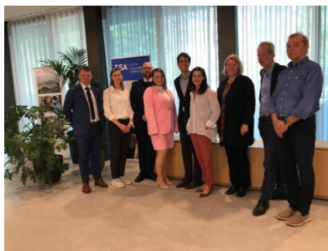
Bilder fra besøket hos ESA