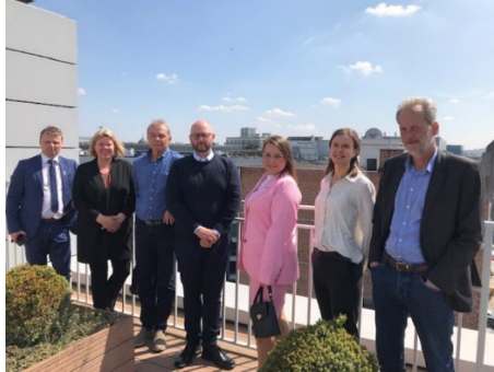
Bilde 1: På vei til Norway House for møte med Norges spesialutsending for regional- og kommunalpolitikk. Bilde 2: Utvalget og sekretariatet samlet på takterrassen på Norway House