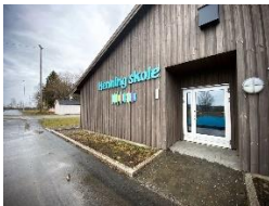
Henning skole har nå fått varsel om flere pålegg.

2. Kartlegging, risikovurdering, tiltak og plan knyttet til vold, trusler om vold og uheldige belastninger: Arbeidstilsynet skal ha fått opplyst at vold, trusler og uheldige belastninger er en risiko ved skolen. Det kan både handle om elever som utagerer og foreldre som er truende eller krevende å samarbeide med. Det er gjort noen tiltak for å redusere faren for vold og trusler. Disse tiltakene skal ikke være dokumentert i HMS-arbeidet, men blitt besluttet av ansatte etter behov. Det er eksempelvis tettere oppfølging av noen elever, selv om det går ut over budsjettet og oppgavene som også burde vært gjennomført. Arbeidstilsynet stiller også spørsmål ved risiko- og sårbarhetsanalysen som er utarbeidet, og ifølge dem ivaretar ikke den minimumskravene i forskriften.