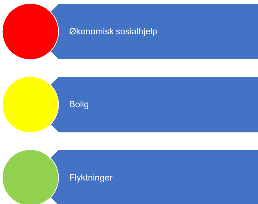
Figur 4. Risikovurdering velferd

I figur 5 er risikovurderingen innenfor velferd oppsummert. I fortsettelsen følger en nærmere beskrivelse av data som er grunnlag for vurderingen