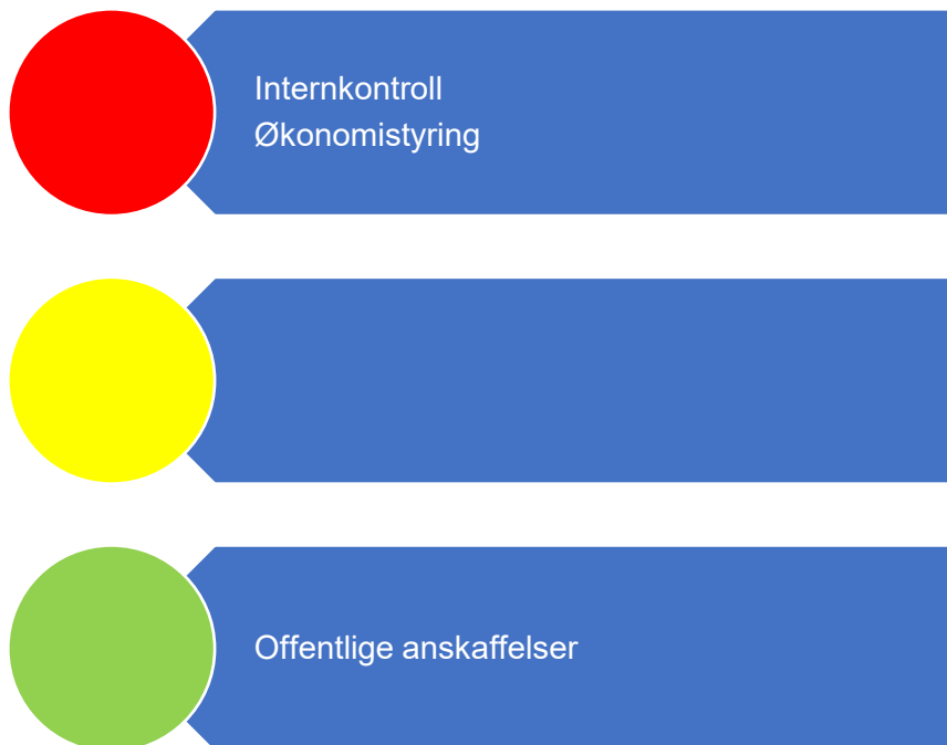
Figur 1. Risikovurdering økonomi

Figur 1 er en oppsummering av risikovurderingene som er gjort relatert til økonomi og i fortsettelsene presenteres bakgrunnen for vurderingene.