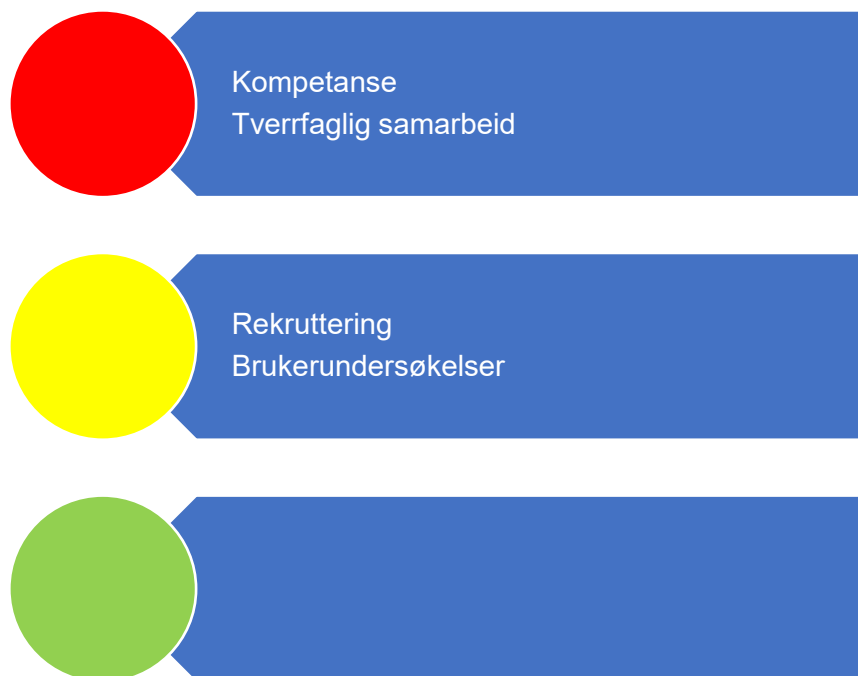
Figur 5. Risikovurdering helse og omsorg

I figur 6 er risikovurderingen innenfor helse- og omsorgstjenester oppsummert. I fortsettelsen følger en nærmere beskrivelse av data som er grunnlag for vurderingen.