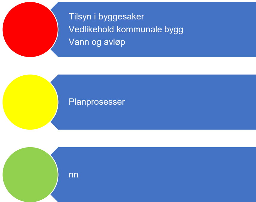
Figur 6. Risikovurdering teknisk

Figur 7 oppsummer risikovurderingene innenfor teknisk drift. Under følger en nærmere beskrivelse av data som er grunnlag for vurderingen.