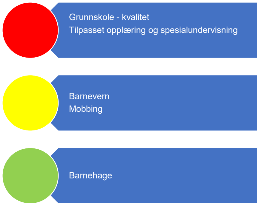
Figur 3. Risikovurdering oppvekst

I figur 4 er risikovurderingen innenfor oppvekst oppsummert og i fortsettelsen følger en nærmere beskrivelse av data som er grunnlag for vurderingen.