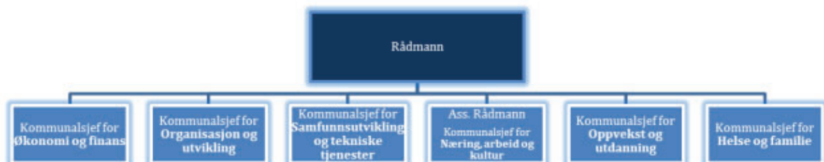
Figur 1. Administrativ organisering (strategisk ledelse)

Toppledelsen i administrasjonen i Ørland kommune består av kommunedirektør og seks kommunalsjefer. Kommunalsjefene har kommunedirektørs myndighet på sine ansvarsområder (se figur under).