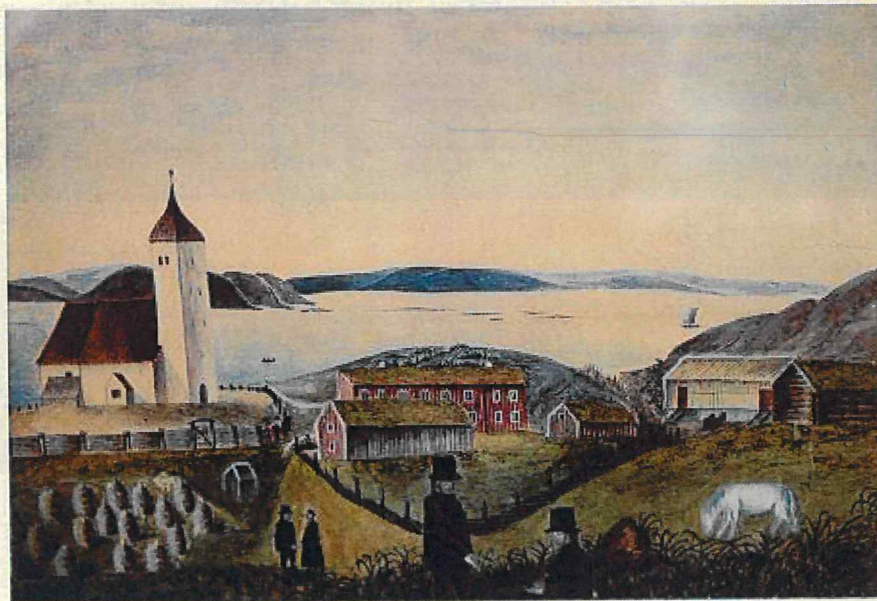
Nærøy Prestegård tidlig på 1800-tallet.