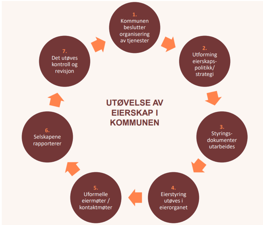
Figur 1. Prinsippskisse for eierstyring