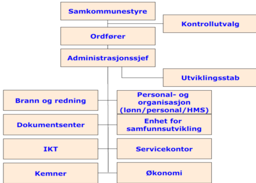
Figur 2 Organisasjonskart ISK pr 31.12.2015

Netto driftsutgifter fordelt på enheter er vist i figur 3: