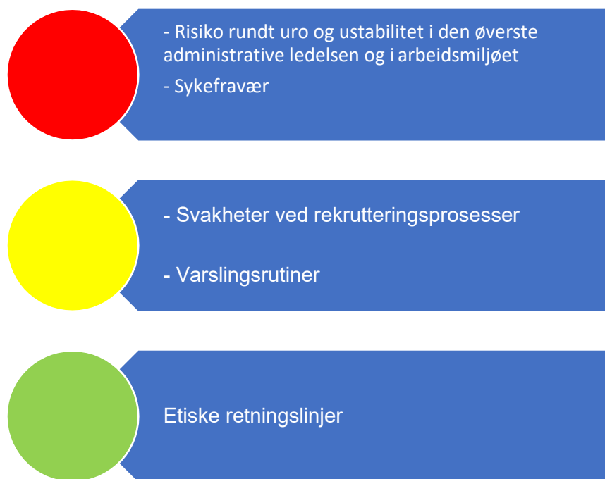
Figur 2. Risikovurdering organisasjon