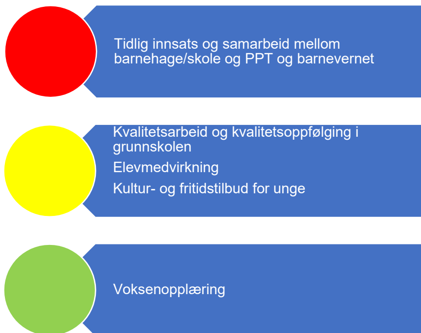
Figur 3. Risikovurdering oppvekst