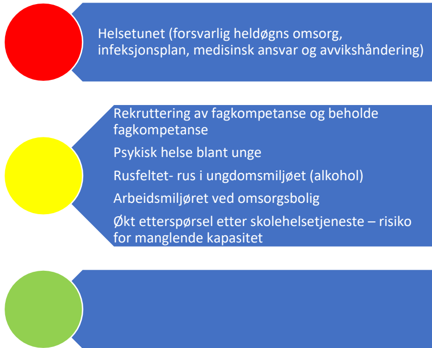
Figur 5. Risikovurdering helse og omsorg

I denne figuren er risiko oppgitt som sannsynlighet*konsekvens for ulike områder under helse- og omsorgstjenester. Under følger en nærmere beskrivelse av data som er grunnlag for vurderingen.