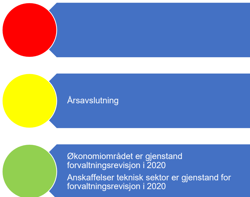
Figur 1. Risikovurdering økonomi

Det første området vi gjennomgår er det økonomiske området. Figuren nedenfor viser hvordan vi vurderer risikoen innen økonomiområdet.