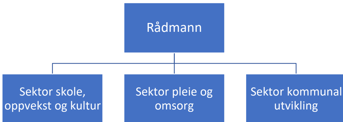
Figur 1. Organisasjonskart – administrativ organisering

Administrasjonen i Meråker kommune er delt i tre sektorer under rådmannen: sektor skole, oppvekst og kultur, sektor pleie og omsorg og sektor kommunal utvikling. Denne sektorinndelingen gjenspeiler den politiske utvalgsstrukturen. Sektorsjefene har det overordnede ansvar for fag, personal og økonomi for respektive tjenester innenfor sin sektor. Vi kommer tilbake til nærmere beskrivelse av tjenestene innen de ulike sektorene senere i rapporten.