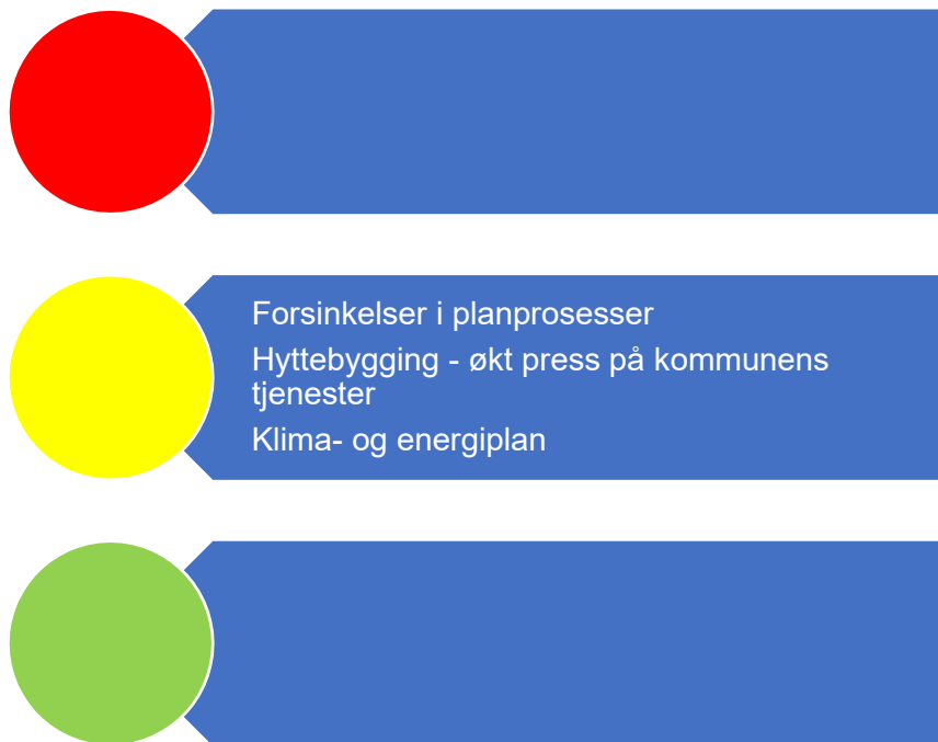
Figur 6. Risikovurdering teknisk

I denne tabellen er risiko oppgitt som sannsynlighet*konsekvens for ulike områder under teknisk drift. Under følger en nærmere beskrivelse av data som er grunnlag for vurderingen.