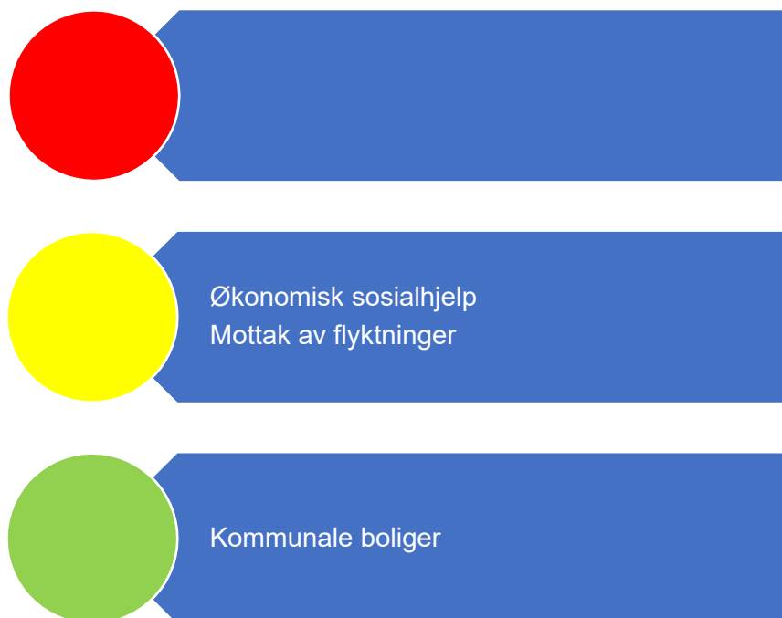
Figur 4. Risikovurdering velferd