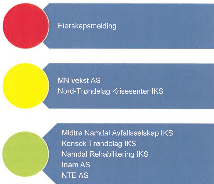
Figur 8. Risikovurdering eierskap

I figur 7 er risikovurderingene knyttet til Flatanger kommune sine eierinteresser oppsummert og grunnlaget for vurderingene er nærmere vurdert i fortsettelsen. Selskaper som trekkes fram til å ha høy eller moderat risiko, bør få gjennomført både eierskapskontroll og forvaltningsrevisjon. Forvaltningsrevisjon i selskaper bør på generelt grunnlag undersøke selskapenes måloppnåelse både opp mot eiers ønsker og selskapets formål. Videre er selvkost i selskaper som er omfattet av dette spesielt relevant. Selskaper som utøver viktige tjenester for kommunen bør få tjenesteutøvelsen revidert.