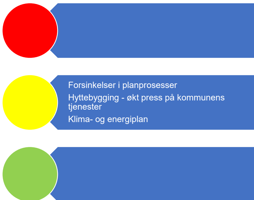
Figur 6. Risikovurdering teknisk

I denne tabellen er risiko oppgitt som sannsynlighet*konsekvens for ulike områder under teknisk drift. Under følger en nærmere beskrivelse av data som er grunnlag for vurderingen.