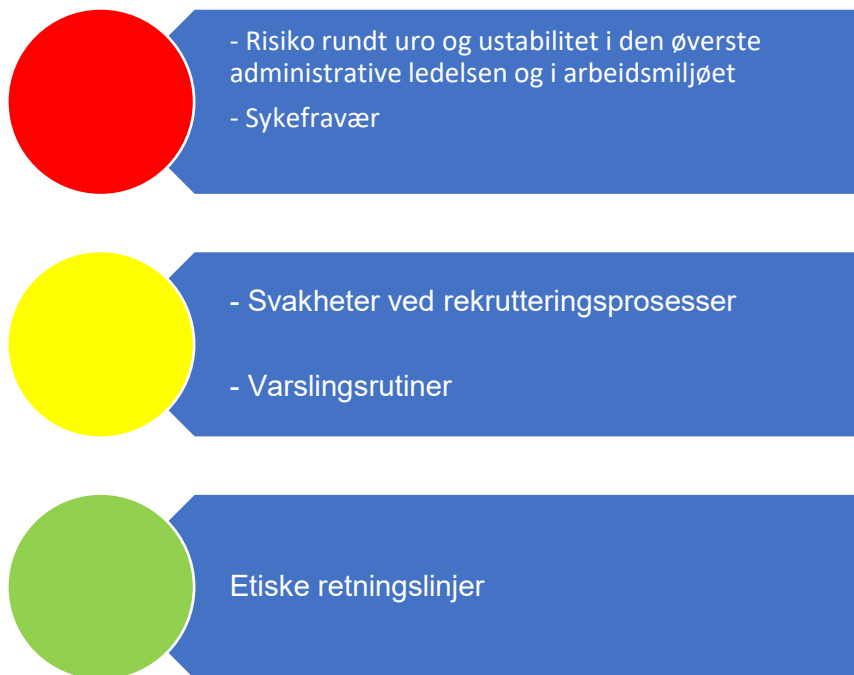
Figur 2. Risikovurdering organisasjon