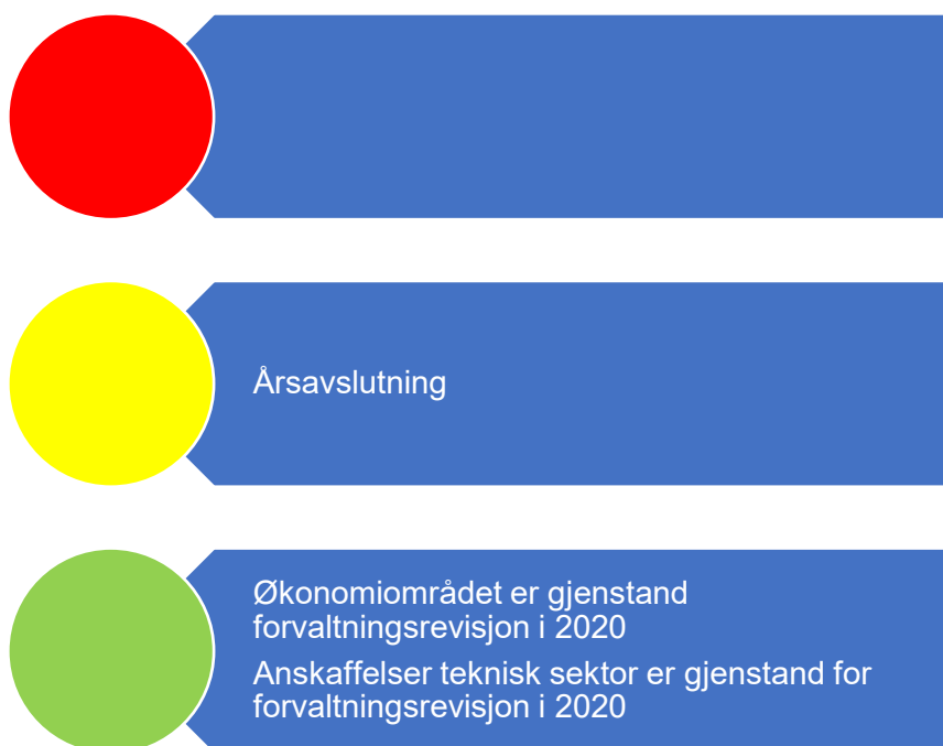
Figur 1. Risikovurdering økonomi

Det første området vi gjennomgår er det økonomiske området. Figuren nedenfor viser hvordan vi vurderer risikoen innen økonomiområdet.