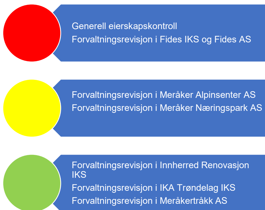
Figur 7. Risikovurdering eierskap