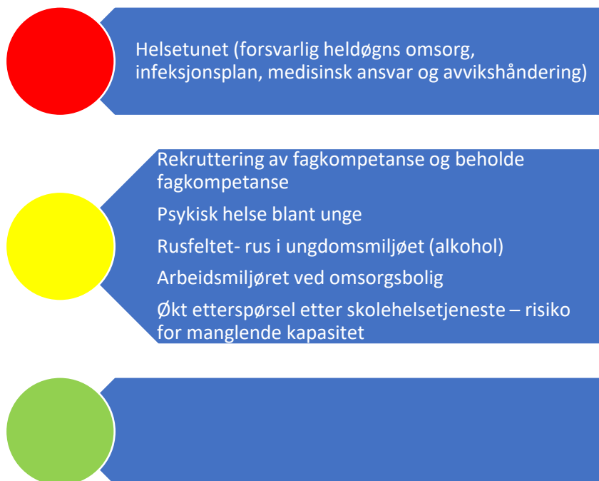
Figur 5. Risikovurdering helse og omsorg

I denne figuren er risiko oppgitt som sannsynlighet*konsekvens for ulike områder under helse- og omsorgstjenester. Under følger en nærmere beskrivelse av data som er grunnlag for vurderingen.