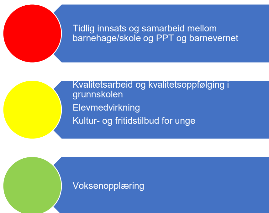
Figur 3. Risikovurdering oppvekst