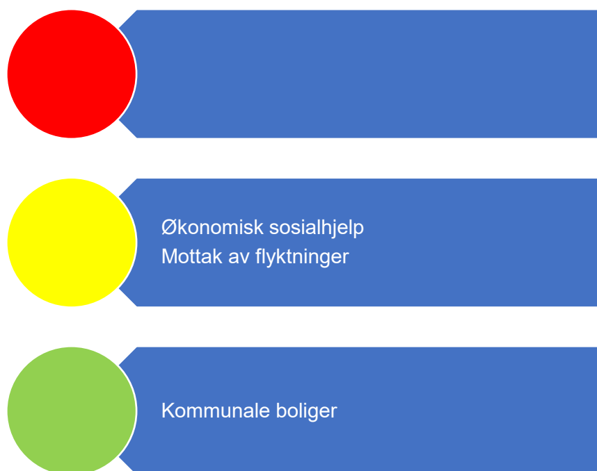
Figur 4. Risikovurdering velferd