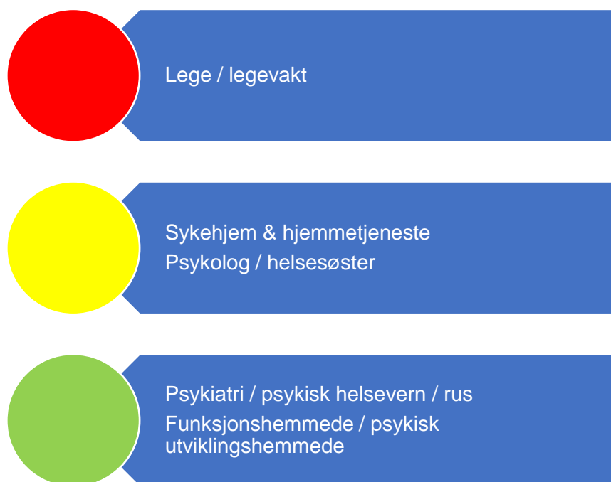
Figur 5. Risikovurdering helse og omsorg

I figur 6 er risikovurderingen innenfor helse- og omsorgstjenester oppsummert. I fortsettelsen følger en nærmere beskrivelse av data som er grunnlag for vurderingen.