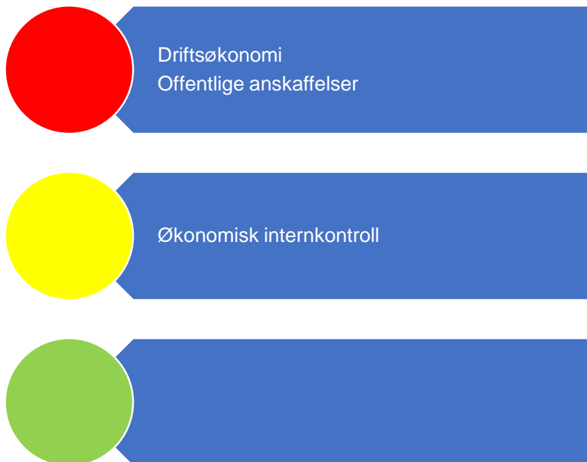
Figur 1. Risikovurdering økonomi

Figur 1 er en oppsummering av risikovurderingene som er gjort relatert til økonomi og i fortsettelsene presenteres bakgrunnen for vurderingene.