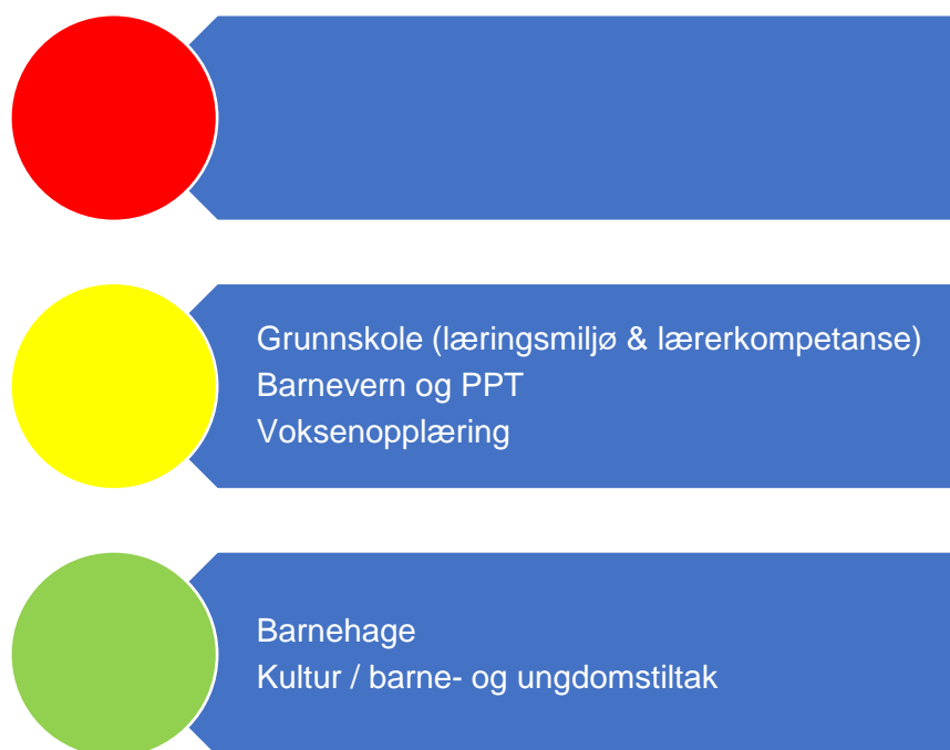
Figur 3. Risikovurdering oppvekst