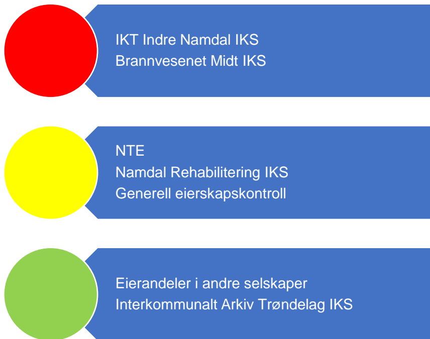
Figur 7. Risikovurdering eierskap

I figur 7 er risikovurderingene knyttet til kommunen sine eierinteresser oppsummert og grunnlaget for vurderingene er nærmere vurdert i fortsettelsen. Selskaper som trekkes fram til å ha høy eller moderat risiko, bør få gjennomført både eierskapskontroll og forvaltningsrevisjon. Forvaltningsrevisjon i selskaper bør på generelt grunnlag undersøke selskapenes måloppnåelse både opp mot eiers ønsker og selskapets formål. Videre er selvkost i selskaper som er omfattet av dette spesielt relevant. Selskaper som utøver viktige tjenester for kommunen bør få tjenesteutøvelsen revidert.