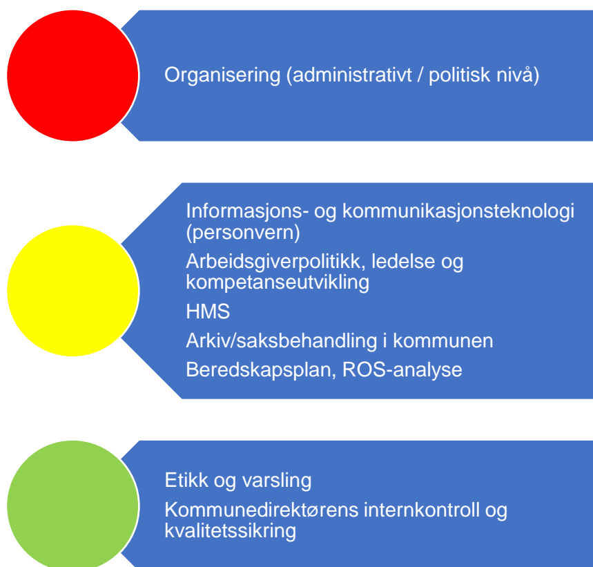
Figur 2. Risikovurdering organisasjon