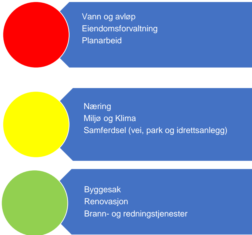
Figur 6. Risikovurdering teknisk

Figur 7 oppsummer risikovurderingene innenfor teknisk drift. Under følger en nærmere beskrivelse av data som er grunnlag for vurderingen.