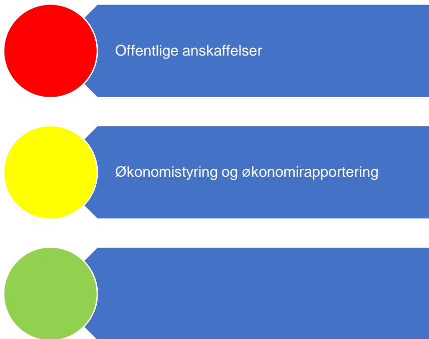
Figur 2. Risikovurdering økonomi

Figur 2 er en oppsummering av risikovurderingene som er gjort relatert til økonomi og i fortsettelsene presenteres bakgrunnen for vurderingene.