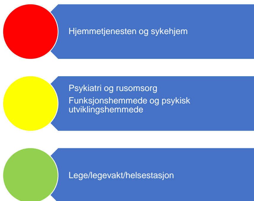
Figur 6. Risikovurdering helse og omsorg

Revisor sin samlede vurdering av risiko og vesentlighet relatert til helse- og omsorgstjenester tilsier at risikoen er høy innenfor hjemmetjenesten og sykehjem. Inderøy opplever økt pågang og behov innenfor tjenestene og kapasiteten er ikke tilpasset behovet. Det er strammere økonomiske rammer og driften er sårbar for endringer i brukerbehovet.