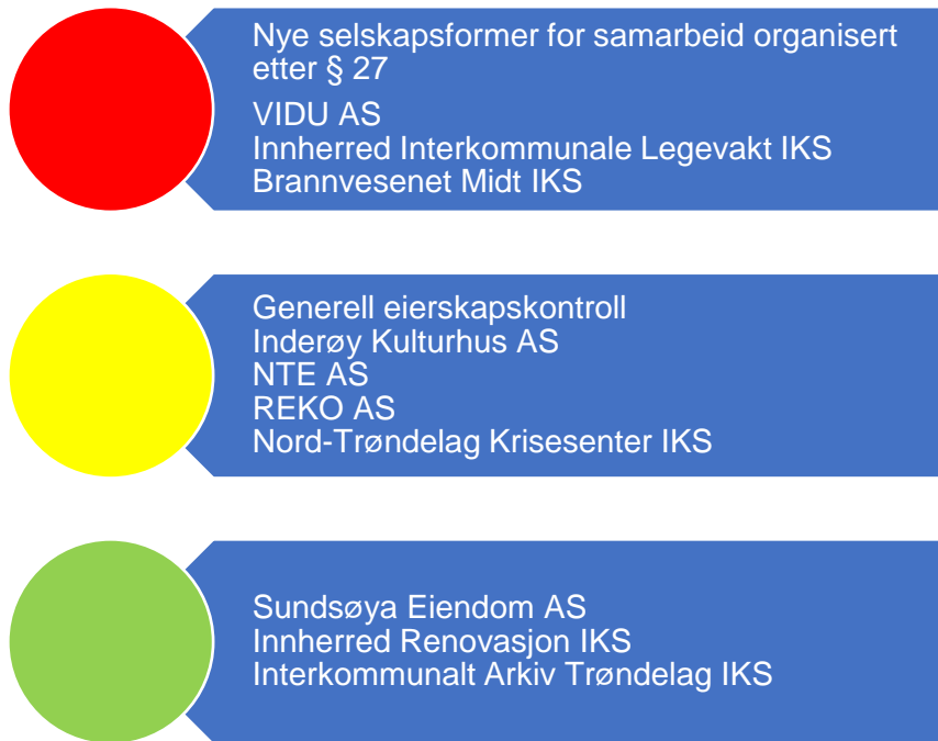
Figur 8. Risikovurdering eierskap

Tabellene nedenfor viser Inderøy kommune sine eierinteresser i AS og IKS.