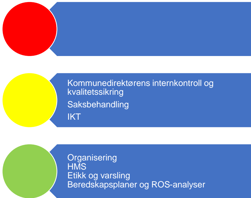
Figur 3. Risikovurdering organisasjon

I figur 3 er risikovurderingen innenfor området organisasjon oppsummert og under følger en nærmere beskrivelse av data som er grunnlag for vurderingen.