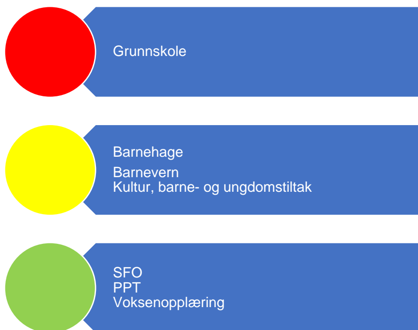
Figur 4. Risikovurdering oppvekst

Revisor sin samlede vurdering av risiko og vesentlighet relatert til oppvekst tilsier at risikoen er høy innenfor grunnskole. På grunnlag av økning i andel elever med spesialundervisning, nedgang i resultater på nasjonale prøver på 8. og 9. trinn, økning i antall mobbesaker på barneskoletrinnet vurderer revisor risikoen på området til høy.