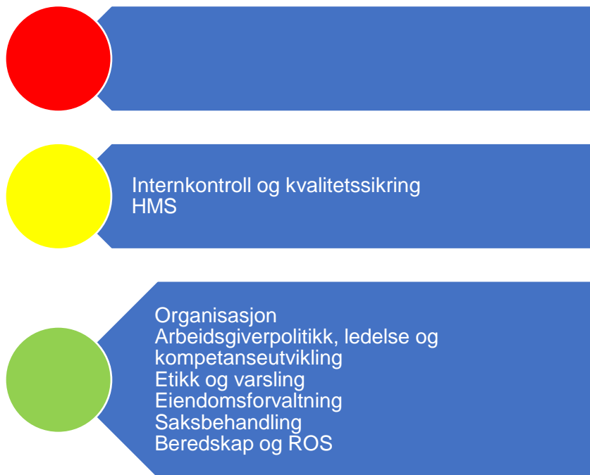
Figur 3. Risikovurdering organisasjon

I denne figuren er risikovurderingen innenfor området organisasjon oppsummert, og under følger en nærmere beskrivelse av data som er grunnlag for vurderingen.