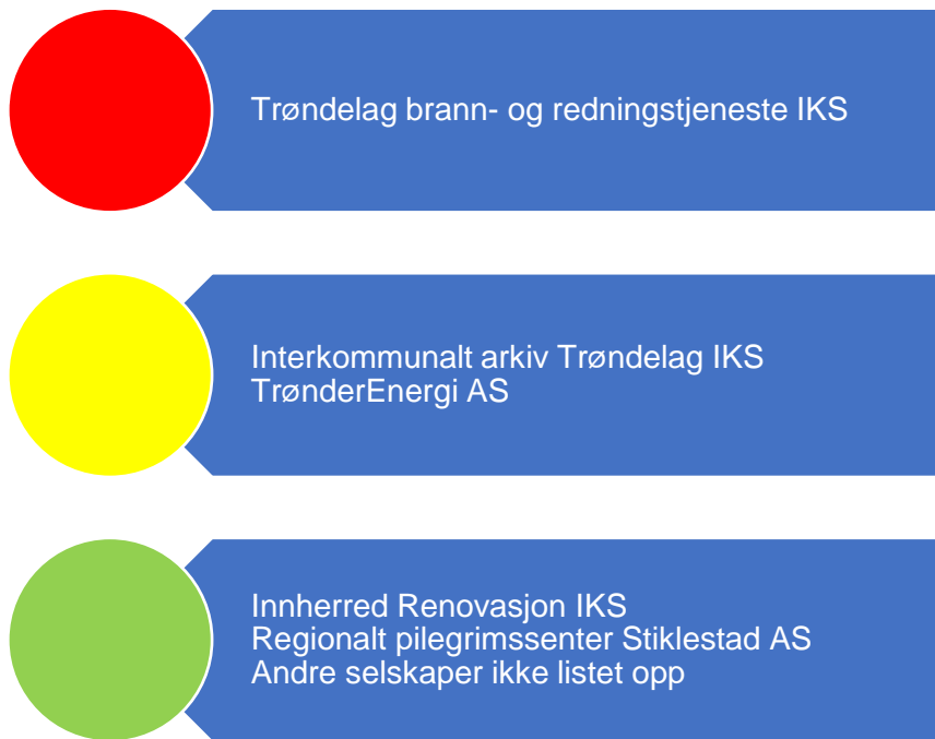
Figur 8. Risikovurdering selskaper

I figuren under er risikovurderingene knyttet til Malvik kommune sine eierinteresser oppsummert, og grunnlaget for vurderingene er nærmere vurdert i fortsettelsen. Selskaper som trekkes fram til å ha høy eller moderat risiko, bør få gjennomført både eierskapskontroll og forvaltningsrevisjon. Forvaltningsrevisjon i selskaper bør på generelt grunnlag undersøke selskapenes måloppnåelse både opp mot eiers ønsker og selskapets formål. Videre er selvkost i selskaper som er omfattet av dette spesielt relevant. Selskaper som utøver viktige tjenester for kommunen, bør få tjenesteutøvelsen revidert.