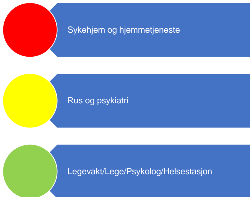
Figur 6. Risikovurdering helse og omsorg

I denne figuren er risikovurderingen innenfor området helse og omsorg oppsummert, og under følger en nærmere beskrivelse av data som er grunnlag for vurderingen.