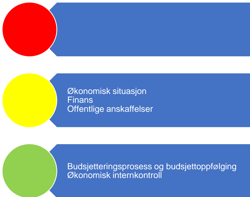
Figur 2. Risikovurdering økonomi

Figuren under er en oppsummering av risikovurderingene som er gjort relatert til økonomi. I fortsettelsen presenteres bakgrunnen for vurderingene.