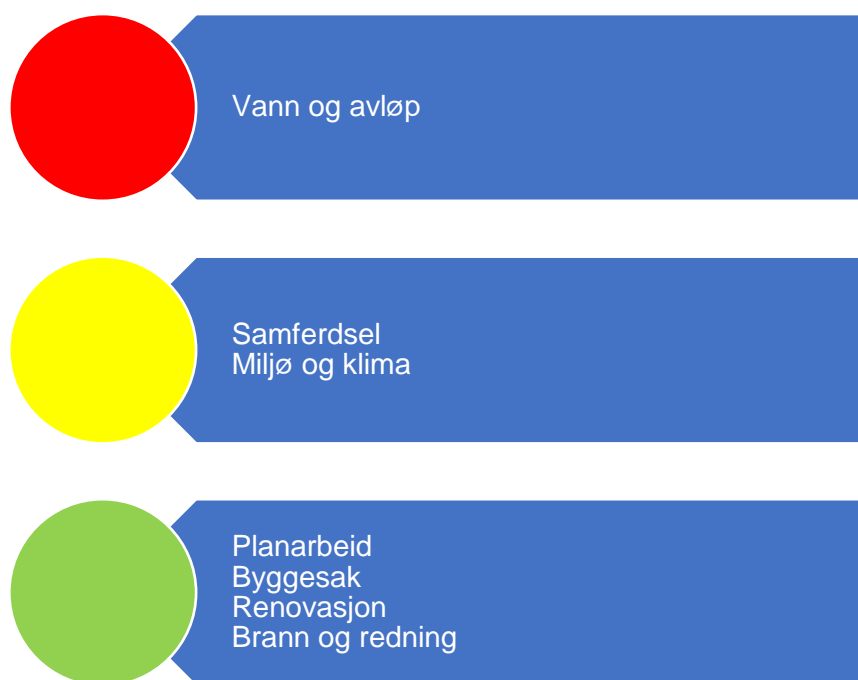
Figur 7. Risikovurdering teknisk

I denne figuren er risikovurderingen innenfor området teknisk oppsummert, og under følger en nærmere beskrivelse av data som er grunnlag for vurderingen.