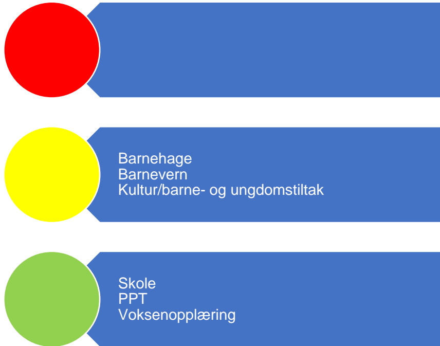
Figur 4. Risikovurdering oppvekst

I denne figuren er risikovurderingen innenfor området oppvekst oppsummert, og under følger en nærmere beskrivelse av data som er grunnlag for vurderingen.