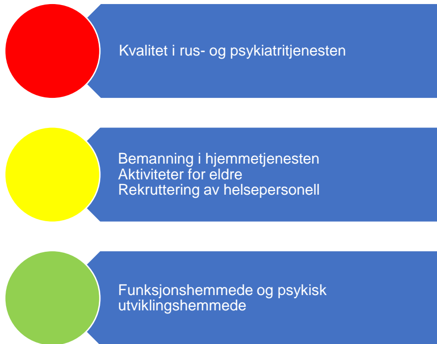
Figur 6. Risikovurdering helse og omsorg

I figur 6 er risikovurderingen innenfor helse- og omsorgstjenester oppsummert. I fortsettelsen følger en nærmere beskrivelse av data som er grunnlag for vurderingen.