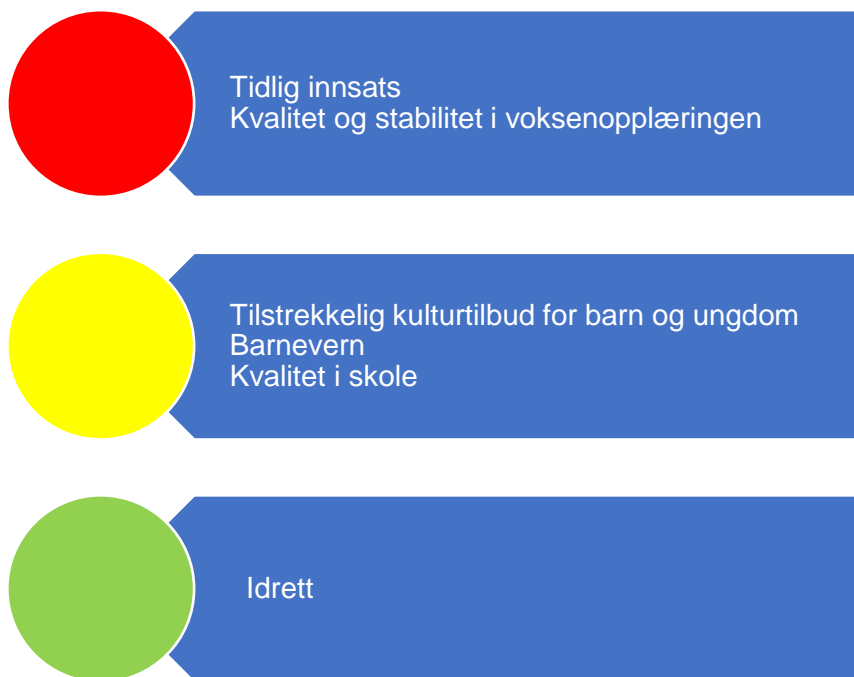
Figur 4. Risikovurdering oppvekst

Revisor sin samlede vurdering av risiko og vesentlighet relatert til oppvekst tilsier at risikoen er høy innen tidlig innsats. Dette på grunn av økende andel barn som mottar tilrettelegging og spesialundervisning i barnehage og skole. Videre er det utfordringer innen saksbehandling i PPT som også taler for at tidlig innsats defineres som et høyrisikoområde. Voksenopplæring er også plassert som høy risiko. Dette på grunn av utfordringer med å tilpasse tilbud til behov, uforutsigbare tilskudd og tjenesten sett i sammenheng med flyktningetjenesten (mer om dette i kapittel 4.2.2).