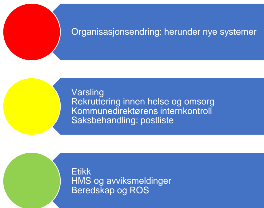
Figur 3. Risikovurdering organisasjon

I figur tre er risikovurderingen innenfor området organisasjon oppsummert og under følger en nærmere beskrivelse av data som er grunnlag for vurderingen.