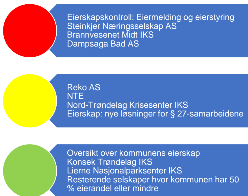
Figur 8. Risikovurdering eierskap og forvaltningsrevisjon i selskaper

I figur 7 er risikovurderingene knyttet til kommune sine eierinteresser oppsummert og grunnlaget for vurderingene er nærmere vurdert i fortsettelsen. Selskaper som trekkes fram til å ha høy eller moderat risiko, bør få gjennomført både eierskapskontroll og forvaltningsrevisjon. Forvaltningsrevisjon i selskaper bør på generelt grunnlag undersøke selskapenes måloppnåelse både opp mot eiers ønsker og selskapets formål. Videre er selvkost i selskaper som er omfattet av dette spesielt relevant. Selskaper som utøver viktige tjenester for kommunen bør få tjenesteutøvelsen revidert.