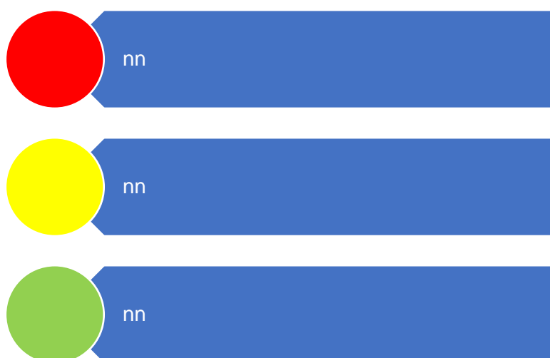
Figur 10. Risikovurdering