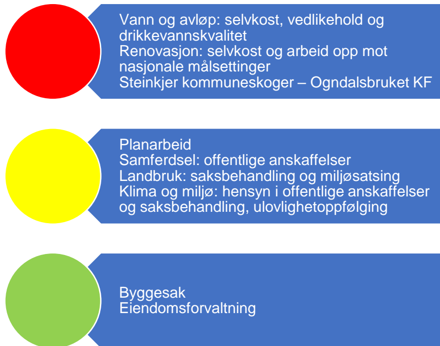
Figur 7. Risikovurdering teknisk

Figur 7 oppsummer risikovurderingene innenfor teknisk drift. Under følger en nærmere beskrivelse av data som er grunnlag for vurderingen.