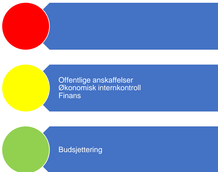
Figur 2. Risikovurdering økonomi

Figur 1 er en oppsummering av risikovurderingene som er gjort relatert til økonomi og i fortsettelsene presenteres bakgrunnen for vurderingene.