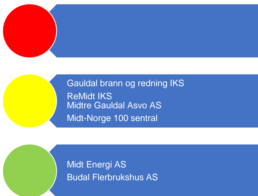
Figur 8. Risikovurdering eierskap

I figur 8 er risikovurderingene knyttet til kommune sine eierinteresser oppsummert og grunnlaget for vurderingene er nærmere vurdert i fortsettelsen. Selskaper som trekkes fram til å ha høy eller moderat risiko, bør få gjennomført både eierskapskontroll og forvaltningsrevisjon. Forvaltningsrevisjon i selskaper bør på generelt grunnlag undersøke selskapenes måloppnåelse både opp mot eiers ønsker og selskapets formål. Videre er selvkost i selskaper som er omfattet av dette spesielt relevant. Selskaper som utøver viktige tjenester for kommunen, bør få tjenesteutøvelsen revidert.