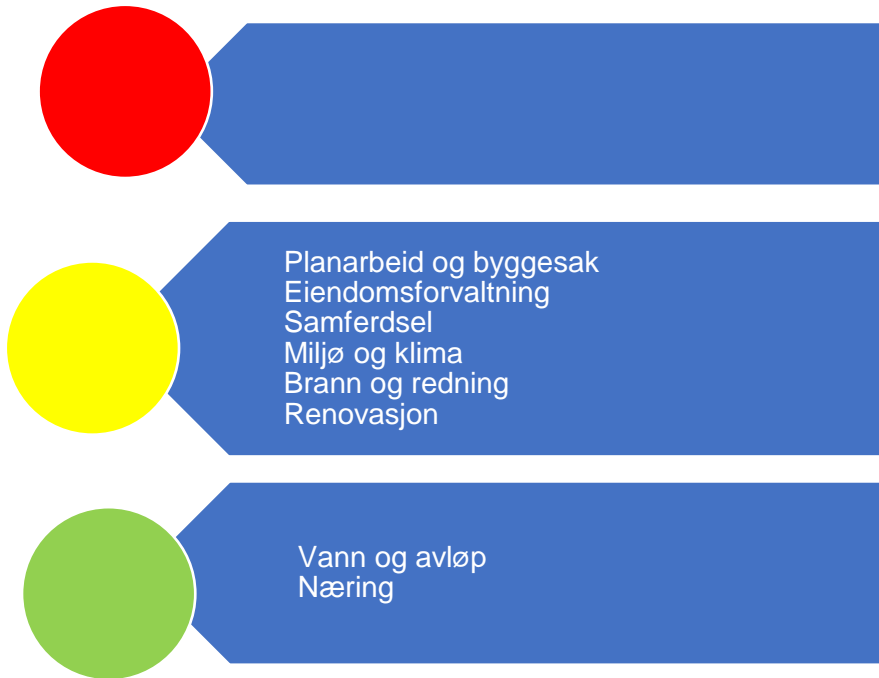
Figur 7. Risikovurdering teknisk

Figur 7 oppsummer risikovurderingene innenfor teknisk drift. Under følger en nærmere beskrivelse av data som er grunnlag for vurderingen.