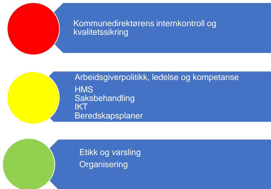
Figur 3. Risikovurdering organisasjon

I figur 3 er risikovurderingen innenfor området organisasjon oppsummert og under følger en nærmere beskrivelse av data som er grunnlag for vurderingen.