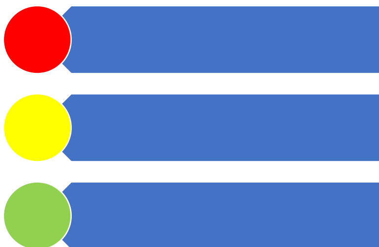
Figur 9. Risikovurdering

Risikovurderingene er oppsummert i figur 9 og visualisert som trafikklys. Vurderinger som fører til henholdsvis lav, middels og høy risiko plasseres der de hører til i figuren.