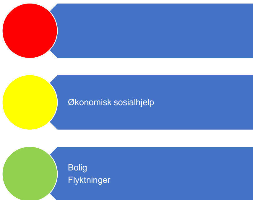
Figur 5. Risikovurdering velferd

I figur 5 er risikovurderingen innenfor velferd oppsummert. I fortsettelsen følger en nærmere beskrivelse av data som er grunnlag for vurderingen