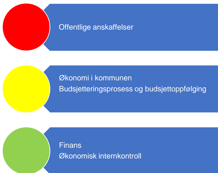
Figur 2. Risikovurdering økonomi

Figur 2 er en oppsummering av risikovurderingene som er gjort relatert til økonomi og i fortsettelsene presenteres bakgrunnen for vurderingene.