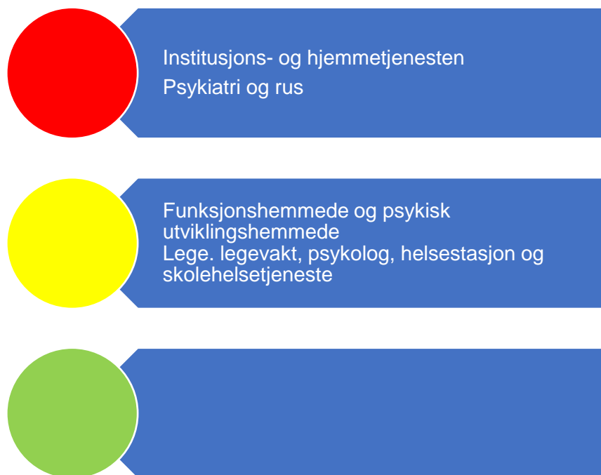
Figur 6. Risikovurdering helse og omsorg

I figur 6 er risikovurderingen innenfor helse- og omsorgstjenester oppsummert. I fortsettelsen følger en nærmere beskrivelse av data som er grunnlag for vurderingen.