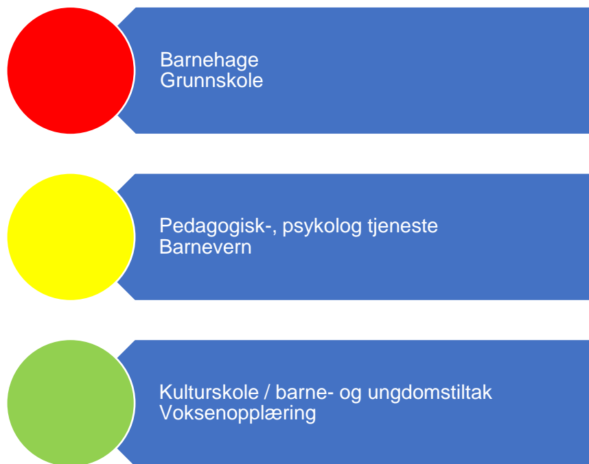
Figur 4. Risikovurdering oppvekst

I figur 4 er risikovurderingen innenfor oppvekst oppsummert og i fortsettelsen følger en nærmere beskrivelse av data som er grunnlag for vurderingen.