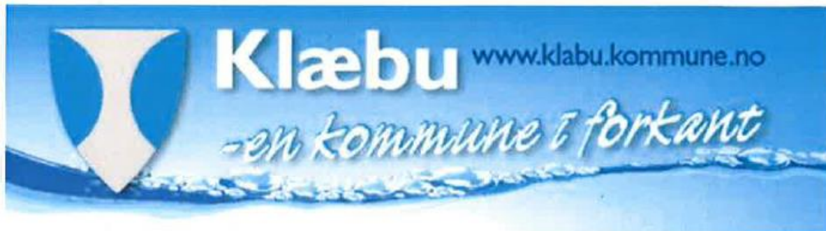
Figur 2. Oppfølgings- og varslingsrutiner skolemiljø, Klæbu kommune.

I Klæbu kommune ble det med virkning fra 1.8.17 innført nye Oppfølgings- og varslingsrutiner – skolemiljø. Dette som en konsekvens av at endringer i opplæringslovens Kap 9A trådte i kraft fra denne datoen. Både ledelse og ansatte sier i intervju at det er informert om disse til alle ansatte, at de er tilgjengelig for alle ansatte og at ansatte har diskutert innholdet i disse. Informasjon om og diskusjon av rutinene har vært en del av planleggingsdagene høsten 2017.