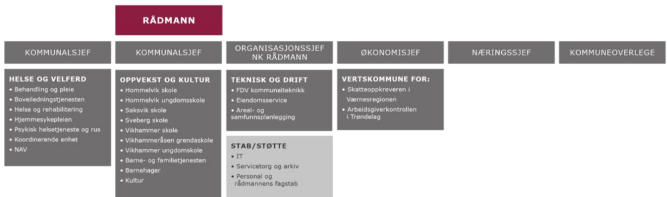
Figur 2 Administrativ organisering i Malvik kommune (malvik.kommune.no)

Når det gjelder beredskapsarbeidet, så følger det administrative ansvaret for dette organisasjonsmodellen ovenfor. Beredskapskoodinatoren jobber i rådmannens stab. Det løpende beredskapsarbeidet innebærer bl.a. planarbeid, øvinger og andre forebyggende aktiviteter.